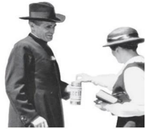
Jesuitenpater Rupert Mayer, Patron der Caritas im Erzbistum, sammelte schon 1935 mit der Caritas-Büchse vor St. Michael in der Münchner Fußgängerzone.

Mitte September finden Sie einen Brief Ihrer Pfarrei im Briefkasten mit der Bitte um eine Spende für die Caritas. Am Sonntag, 02. Oktober findet die Kirchensammlung statt.